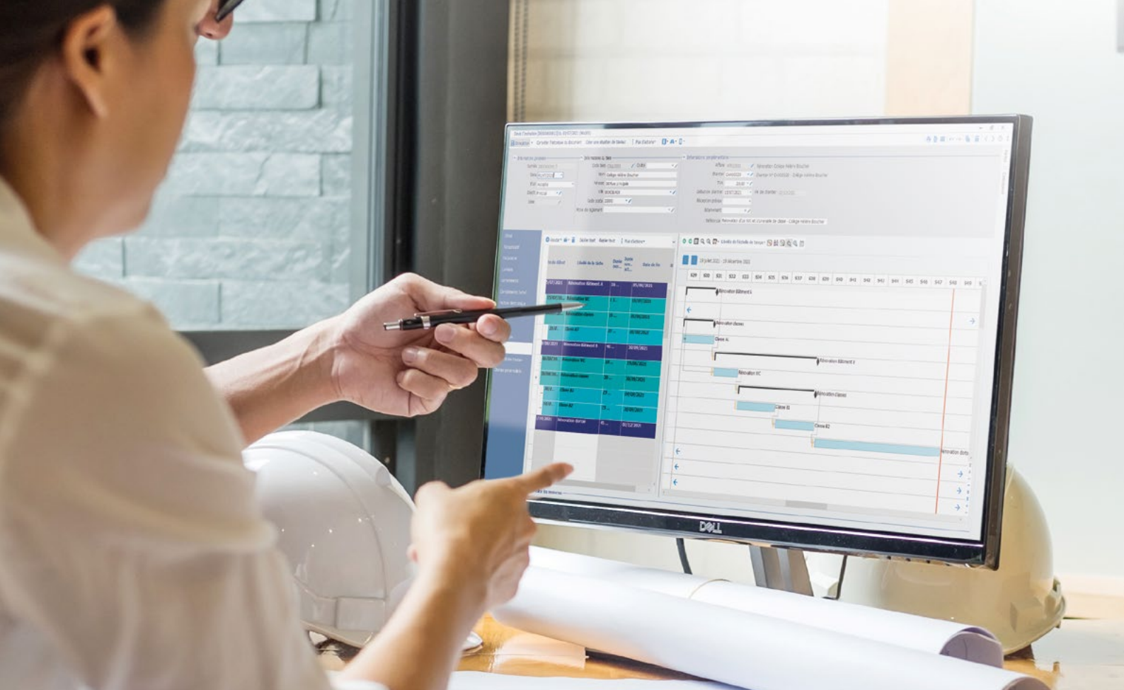
Depuis le devis d'exécution, planifiez les différentes tâches du chantier.